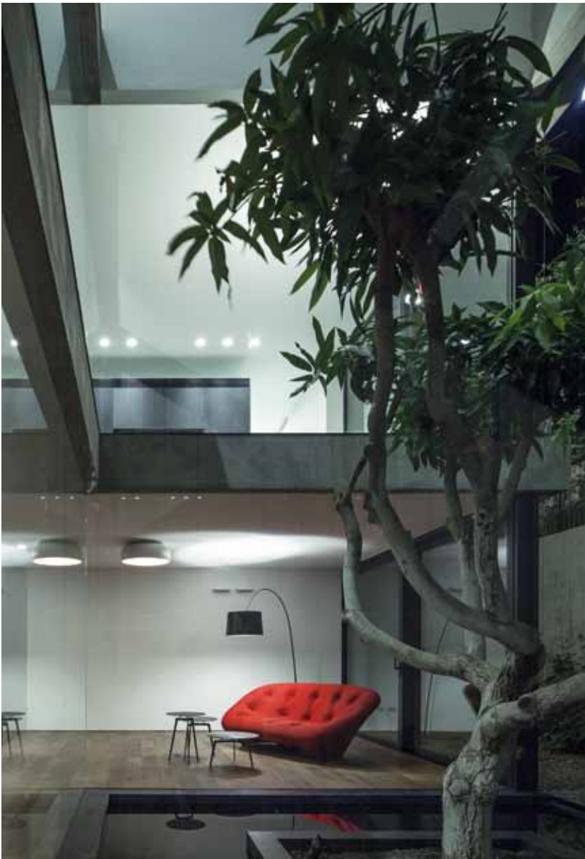
Search jarum jam: Couch berwarna merah yang berhasil menghidupkan ruangan tamu. Penggunaan mirror persegi di area bathroom yang stylish .