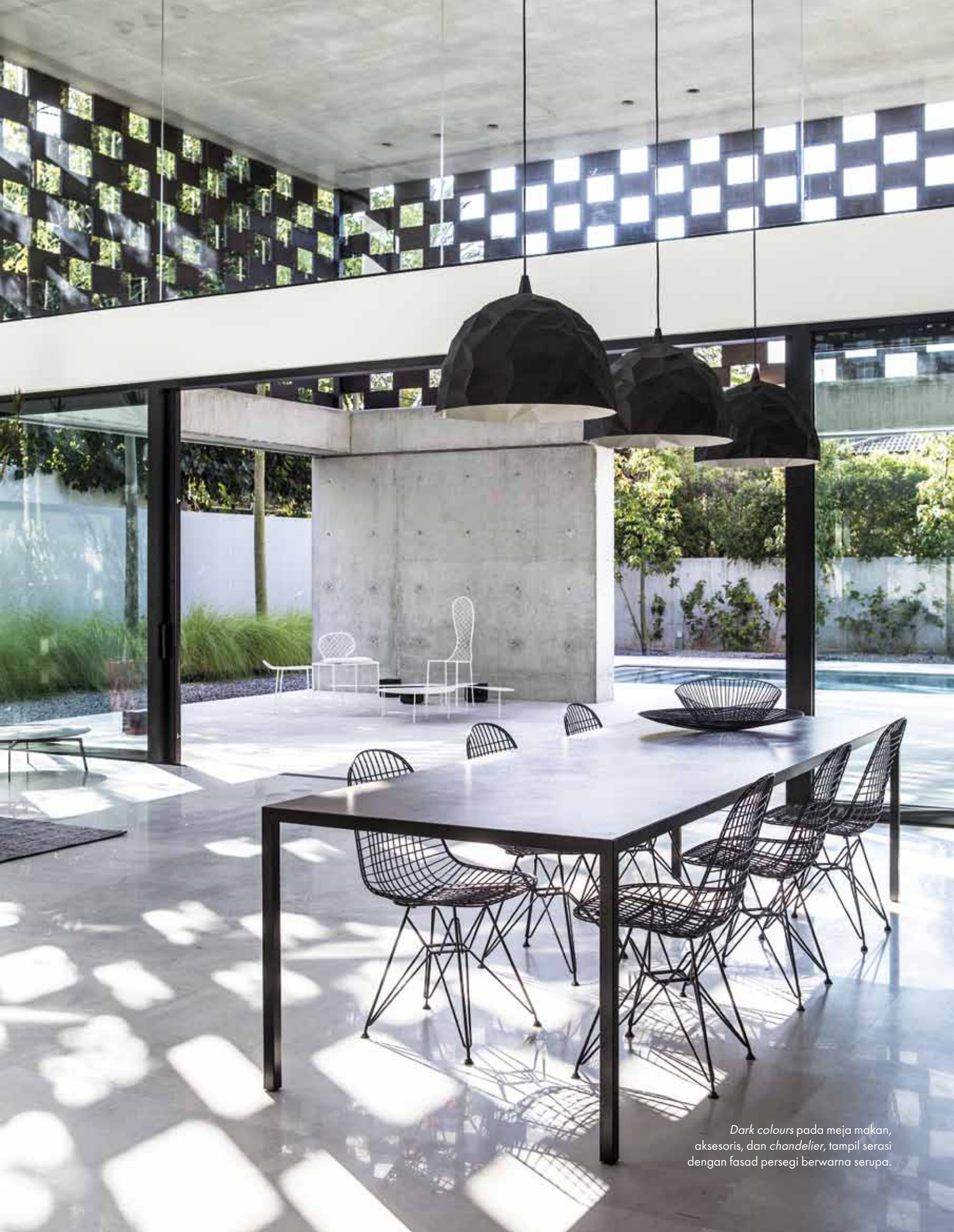
Dark colours pada meja makan, aksesoris, dan chandelier, tampil serasi dengan fasad persegi berwarna serupa.