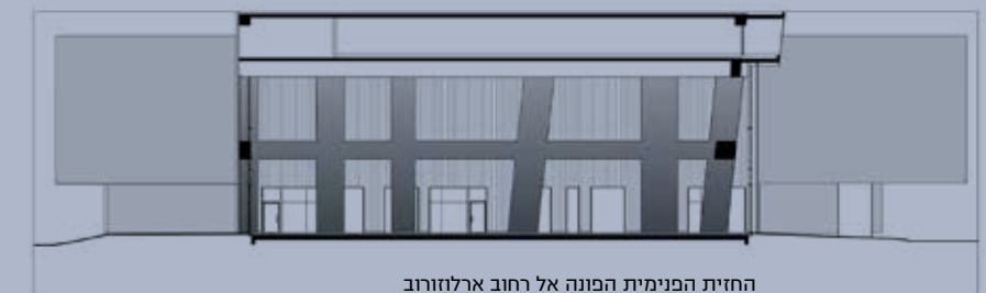
החזית הפנימית הפונה אל רחוב ארלזורוב