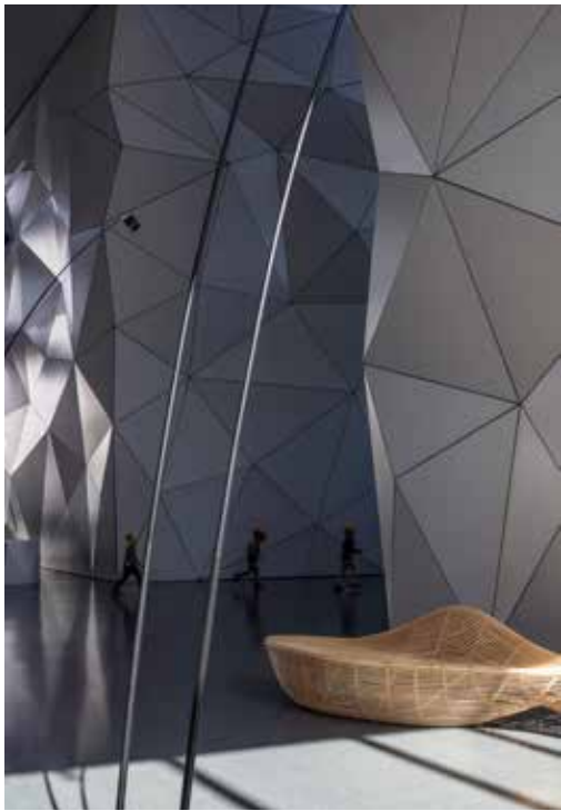
למטה – מימין: הצצה מן הלובי לרח' ארלזוהוב במרכז: בריכת השחייה במבט על משמאל: חלל הכניסה המרכזי. חיבור לחלל האטריום