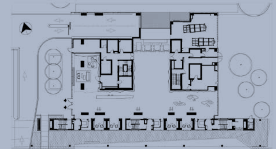
תכנית קומת כניסה