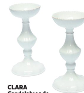
CLARA Candelabros de cerámica, $15.000 c/u (Larry Diseño, Av. Italia 1449, L. 8)