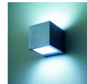
DOBLE LUZ Aplique para interior, $21.151 (Opendark, El Bosque Norte 0158)