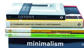
IDEAS London minimum, $15.800; Le Corbusier and the power of photography, $36.800; Arte minimalista, $9.900; Mies van der Rohe, $9.900; Minimalism, $34.800 (Librería Contrapunto, Drugstore, L. 10 y 11, Providencia)