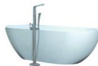
PURIFICARSE Tina de resina sólida The Collection, consultar precio en tienda (Atika, Av. Vitacura 5770)