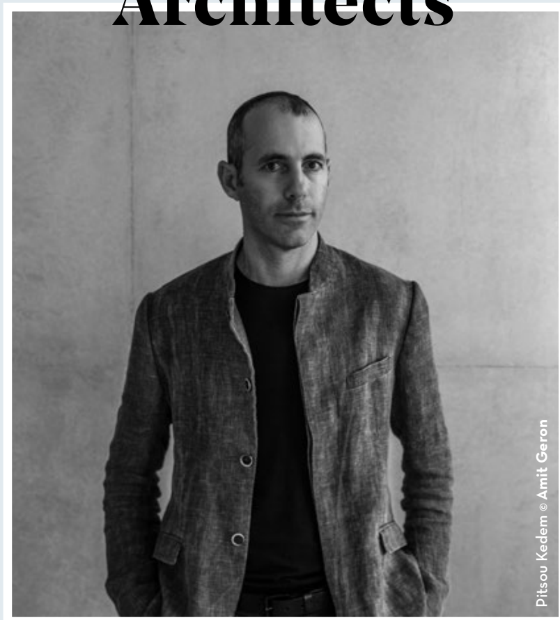
Pitsou Kedem