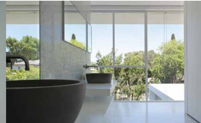
Ramat Hasharon House