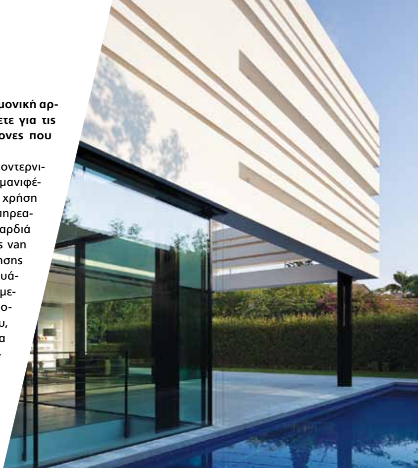
Ramat Gan House

The main idea was to create a structure that would be so minimalistic, anonymous and restrained that it would appear almost as if it could be a statue or an object within the plot rather than a house as we traditionally conceive of a house.