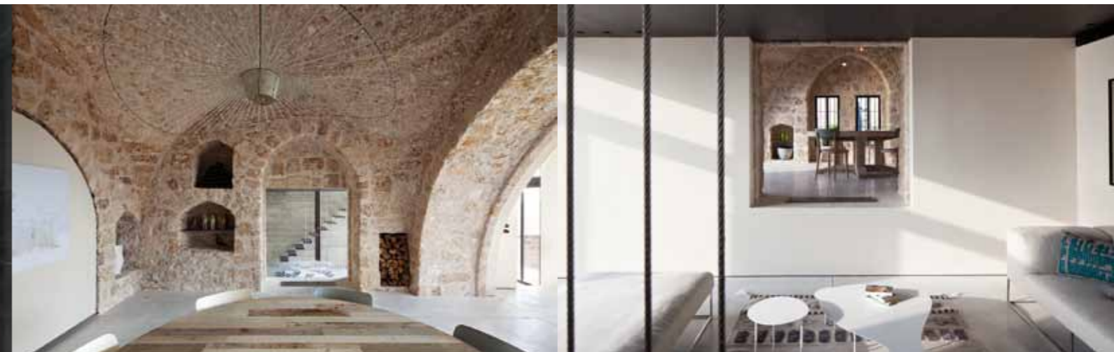
Factory Jaffa House