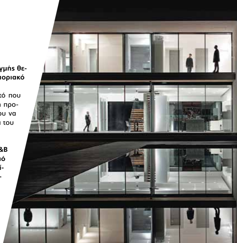
Kfar Shmaryahu House

Therefore I was never forced to fight for my vision, my design or my principals. Their expectation was that I would merge my vision into their project.