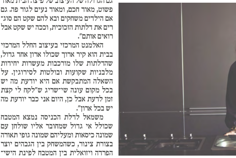
מיקום: רחוב אנטוקולסקי, תל אביב קומה: 4 מספר חדרים: חמישה - סלון ומטבח בחלל גדול אחד, שני חדרים ילדים, חדר שינה וחדר שירות טוח: 250 מ"ר כמה זמן בבית: חצי שנה

אחד הרבנים הבולטים ברורה של מעצבת האופנה ג'רי שיריג, הוא האפי הרמטי שמקנה הצ" בע השחור ששולט בחלל: בפינת הישיבה, בגופי התאורה, בארון הקיר שמשטרע לרחוב הסלון, ואפילו בבגדים שלובשת בעלת הבית. "לעיתים יש לי הברקות של צבע, זה תלוי במצב רוח, אבל לרוב זה שחור", היא אומרת בחיך. "כשהייתי סטודנטית הייתי מאוד צבעונית, לא היה לי פריט שחור אחד בארון, אבל זה שלב שהסתיים. פג תופק". שיריג גם לא מסכימה שמרובר במי שחור דומה לא מתייחס למגורים. "זה אני. זה נראה מאוד רמטי אבל כשאתה חי פה זה הופך להיות חלק מהחיים שלך. אותי לדוגמה זה מרגיע, וזה תמיד נראה נורא נקי גם אם זה לא", היא צוחקת. "כל הזמן אני אומרת אולי נוסף נקודה של צבע אבל בסוף הכל נשאר שחור ולכן יש נקודת צבע אחת", היא נזכרת, "כשירותי אורחים. יש שם מרפ סגול. וגם אצל הילדים יש צבע".