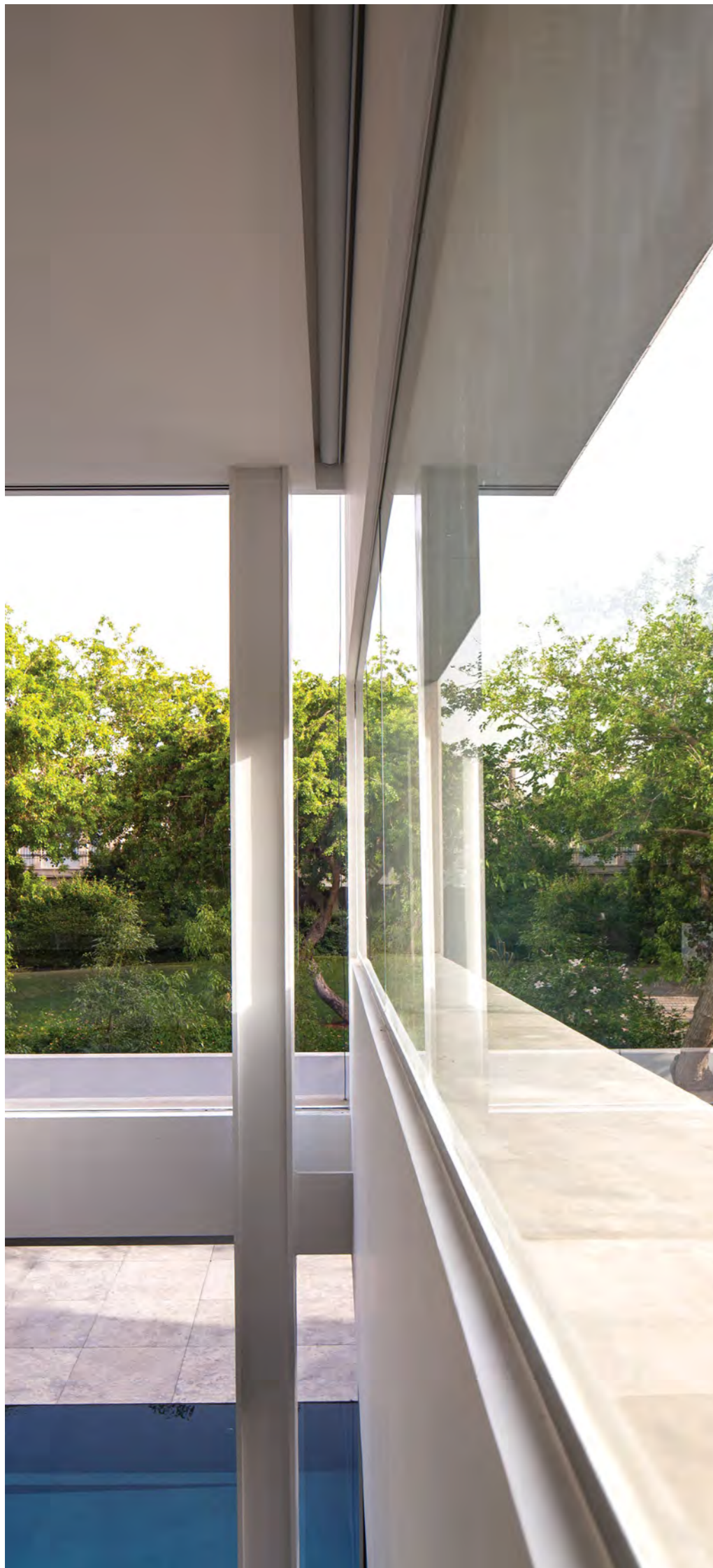
העמודים הפנימיים מאפשרים לאלמנטים החומריים לבלוט בחזיתות

בסלון ובפינת האוכל נמשך הקו המהודק והמינימליסטי של האדריכלות, ובתוך הבית נעשה שימוש בבטון גם בקירות וגם ברצפה שיוצרת תחושה שהחומר הזה עוטף סכל כיוון, כשמאחורי הבחירה הזו עומדת התפישה העיצובית של אמונה בשפה אחת ולא בניבוב חומרים. בה בעת הריהוט מרכך את האדריכלות- גם בחומרות כדוגמת רכות של בדים, וגם בצורניות כדוגמת השולחנות המעוגלים. עוד דרך לריכך החלל היא הכנסת צבע, ופה מופיעות נגיעות של צהוב באקססוריוז ובריהוט הנייד, צבע שעובד טוב עם הבטון והלבן שסביבו. מעל כל אלה חולש גוף התאורה שמרכך את הקונטרסט בין הקווים הישרים וכובד המסה ומייצר קלילות בחלל. חלל הסלון כפול ופתוח כלפי הגינה הדרומית והמערכת יוצר קשר מבטים בין החוץ והפנים. תודות לקונסטרוקציה פנימית האלמנטים החומריים בולטים בחזיתות, ומשרתים בנוכחותם המלאה את סיפור הבית. פועל יוצא מכך הוא שהחזית האחורית בולטת בשקיפותה ומהבריכה שצמודה לסלון הבית נראה כמעט מרחף. הפרטים סביב הבריכה מדויקים ברמת גימור גבוה עד כדי ששפת הבריכה נראית כחלק מהריצוף. על כל אלה משקיפה הספרייה שמעל הסלון ובכך אחראית על הקשר בין החללים ועל השיח איתו שמייצר דיאלוג. תפקיד נוסף יש לה בהכנסת צבעוניות למרחב ששומר על איפוק בגווניו, כמו גם נגיעה של תרבות. ←