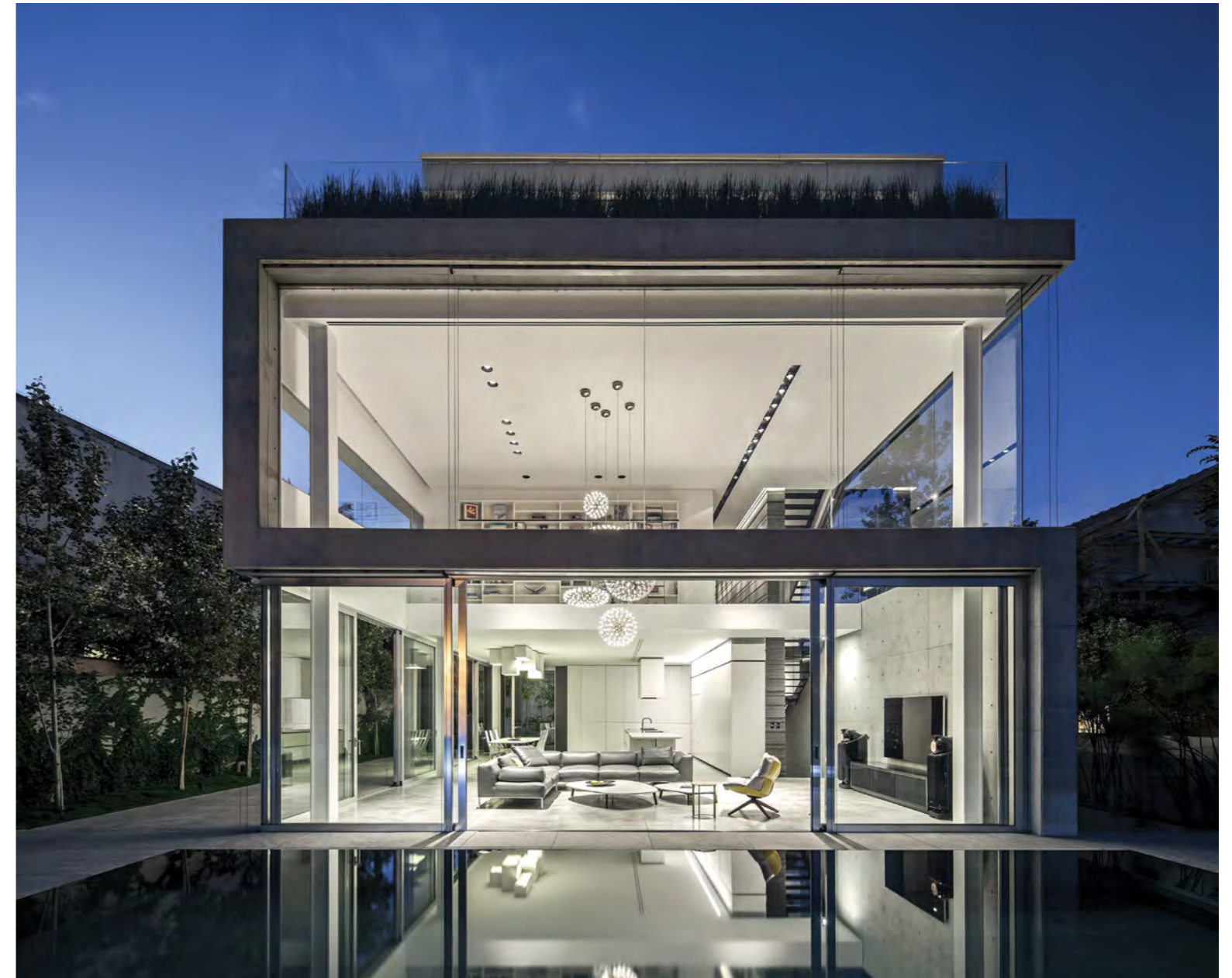
בעוד שהחזית הקדמית שומרת על אטימות כלפי הרחוב החזית האחורית חשופה כליל לכיוון הבריכה