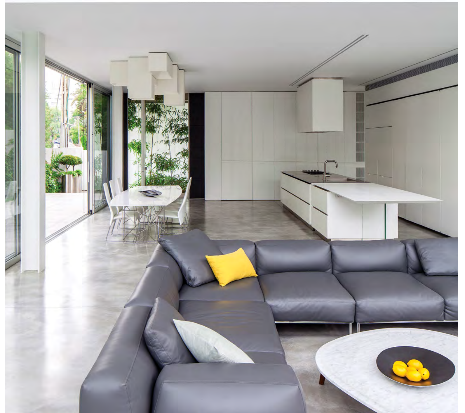
הספרייה אחראית על הכנסת צבעוניות למרחב ששומר על איפוק בגווניו, כמו גם הכנסת תרבות. נגיעות של צהוב באקססוריוז ובריהוט הנייד עובדות טוב עם הבטון והלבן שסביבו