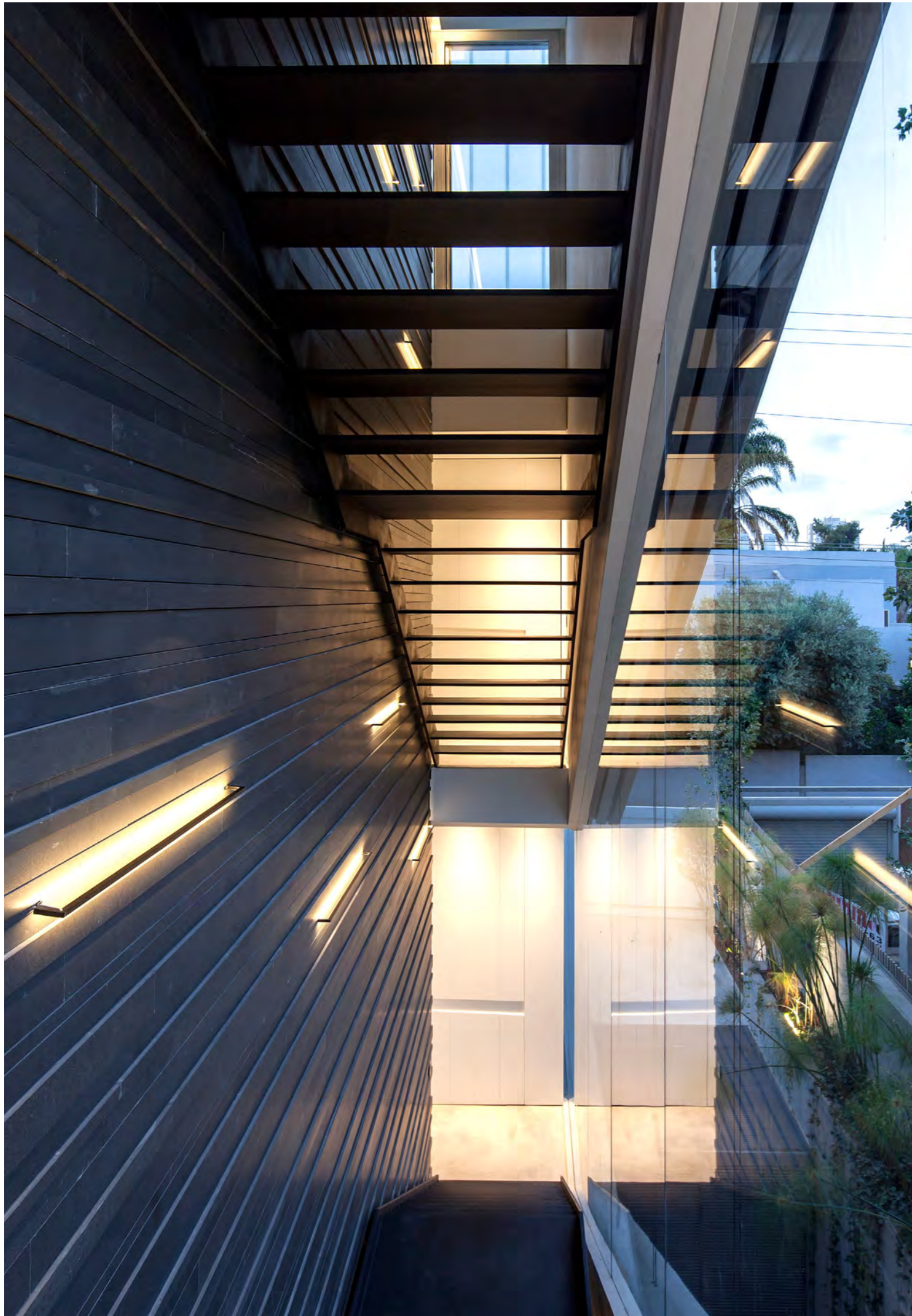
בקיר הבזלת מושתלים גופי תאורה ומסמלים היעדרות נוכחת - היעדרות של גופי התאורה ונוכחות האור

בית שתכנן האדריכל פיזו קדם הוא יצירה אדריכלית הטומנת בחובה משחק בין מסות, שמתאפשר בזכות השימוש בחומרים שבאים מעולמות מנוגדים כמו הבטון הגולמי, האל-זמני, והזכוכית האלגנטית. בבסיס התכנון נמצא הקו שבפשטותו מסוגל לבטא את הרעיונות המורכבים ביותר כמו תנועה או התכנסות, לצד היכולת לבטא גבול - כזה התחום בין עולמות ובו בזמן מפגיש ביניהם זה לצד זה. ככזה, הוא קו הגבול שבין החומרים הללו, שמפריד ביניהם ומפגיש אותם סימולטנית. במבנה הזה הקו משמש כגבול בין חומרים אך לא רק, אלא גם מחדד את תנועתיות הבית ממזרח או מגלה את התנועה שבתוך הבית כשהוא פוער חלון בבטון מדרום. כך נוצרה מעטפת מינימליסטית שמציגה לראווה שלוש מסות העומדות זו על זו, היוצרת תחושת אי-נוחות אצל המתבונן לגבי הקונסטרוקציה שלא ברור בה איך כל מסה תומכת או נתמכת בשנייה וכיצד המבנה עומד איתן ויציב.