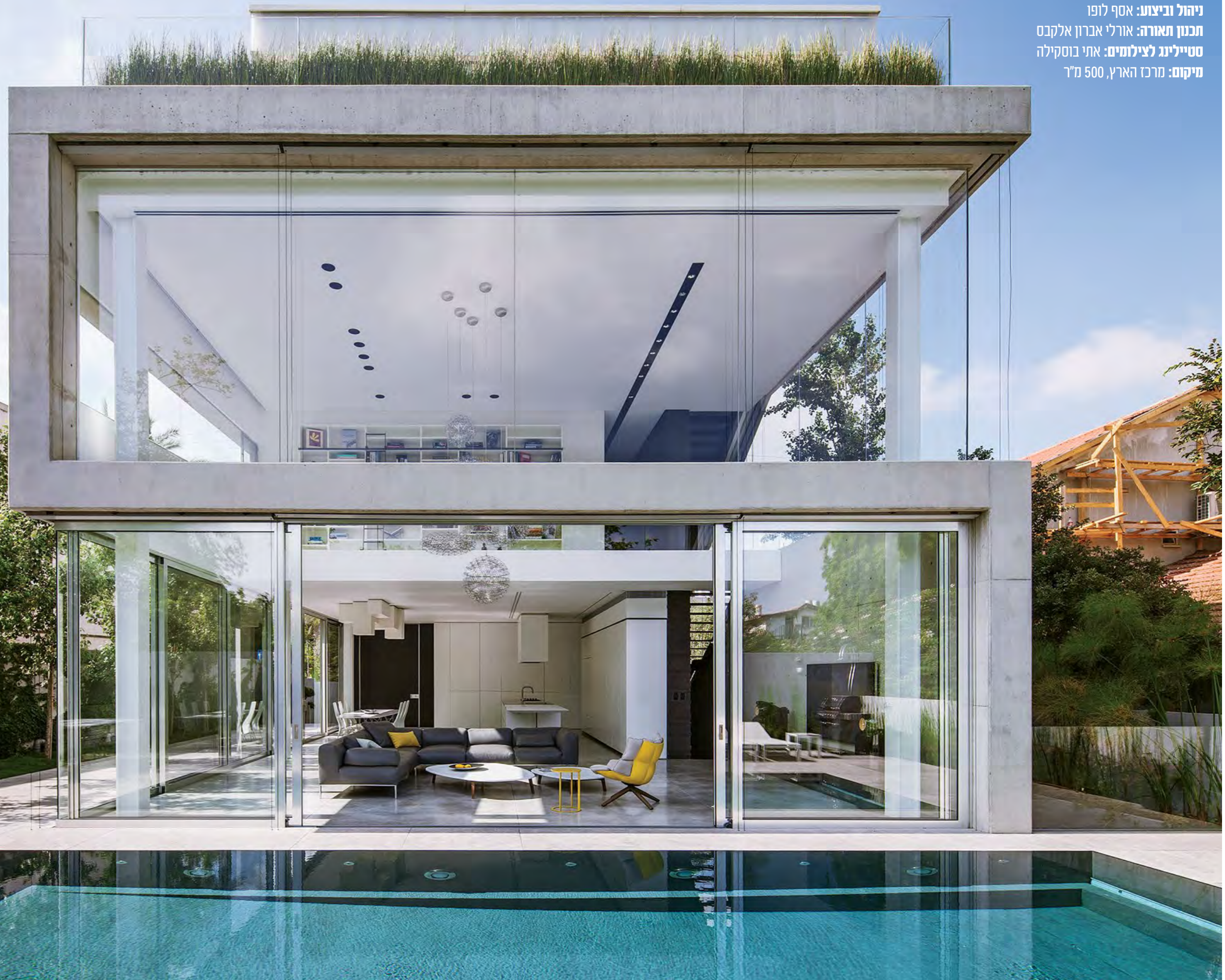
יצירה אדריכלות הטומנת בחובה משחק בין מסות, וחומרים מעולמות מנוגדים כמו הבטון הגולמי והזכוכית האלגנטית

כתיבה: עינת רייטן אדריכלות: פיצו קדם אדריכלים צוות תכנון: פיצו קדם, נועה גרומן אדריכלית אחראית: נועה גרומן ניהול וביצוע: אסף לופו תכנון תאורה: אורלי אברון אלקבס סטיילינג לצילומים: אתי בוסקילה מיקום: מרכז הארץ, 500 מ"ר