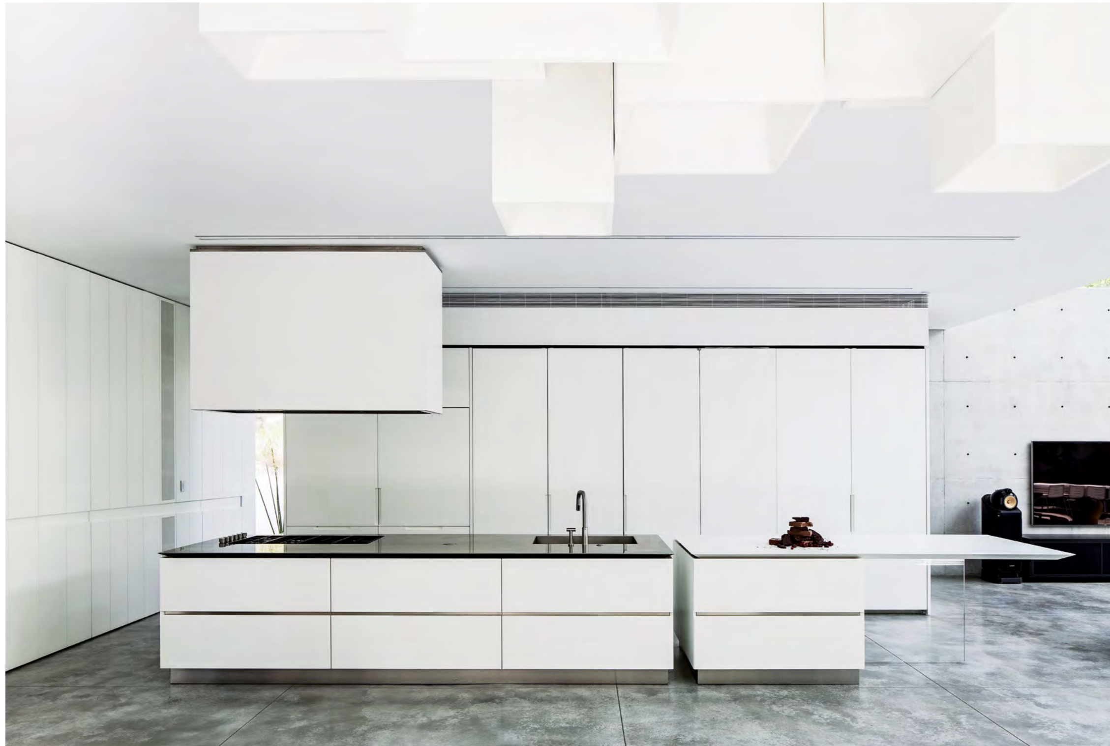
המטבח נראה כמו גוש קרח לבן, מאופיין במקצב שמופיע בארונות ובמשטח העבודה