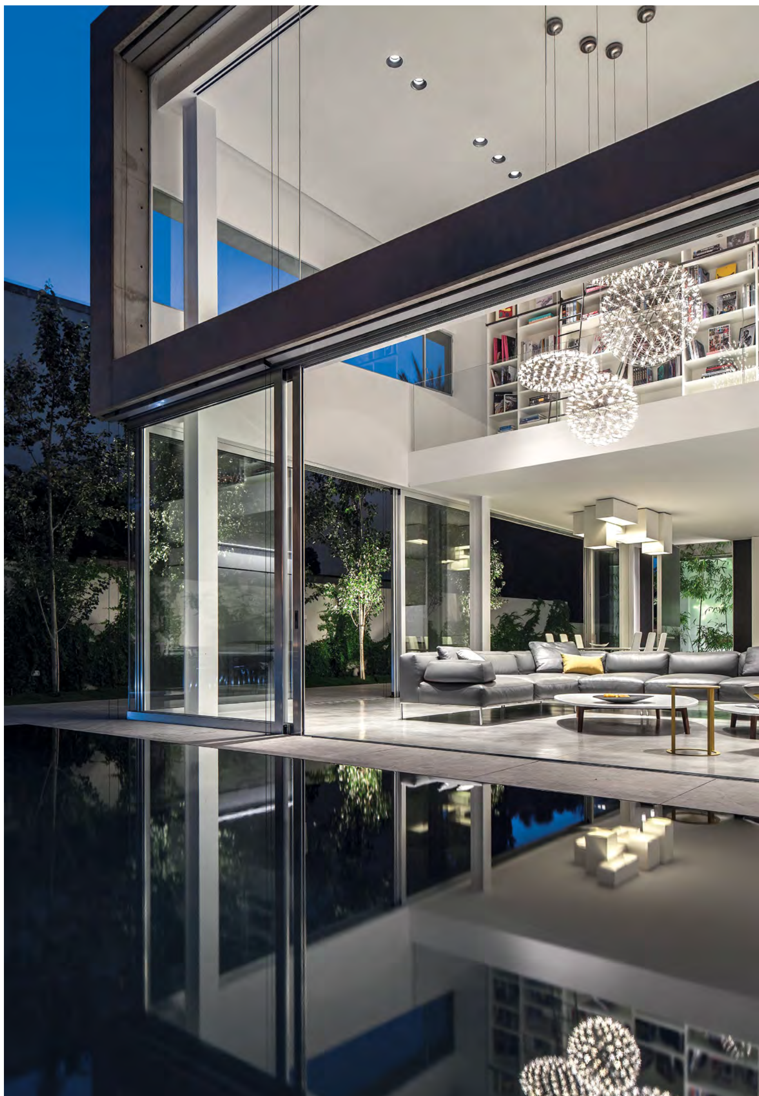
תודות לקונסטרוקציה פנימית, החזית האחורית בולטת בשקיפותה ומהבריכה הבית נראה כמעט מרחף