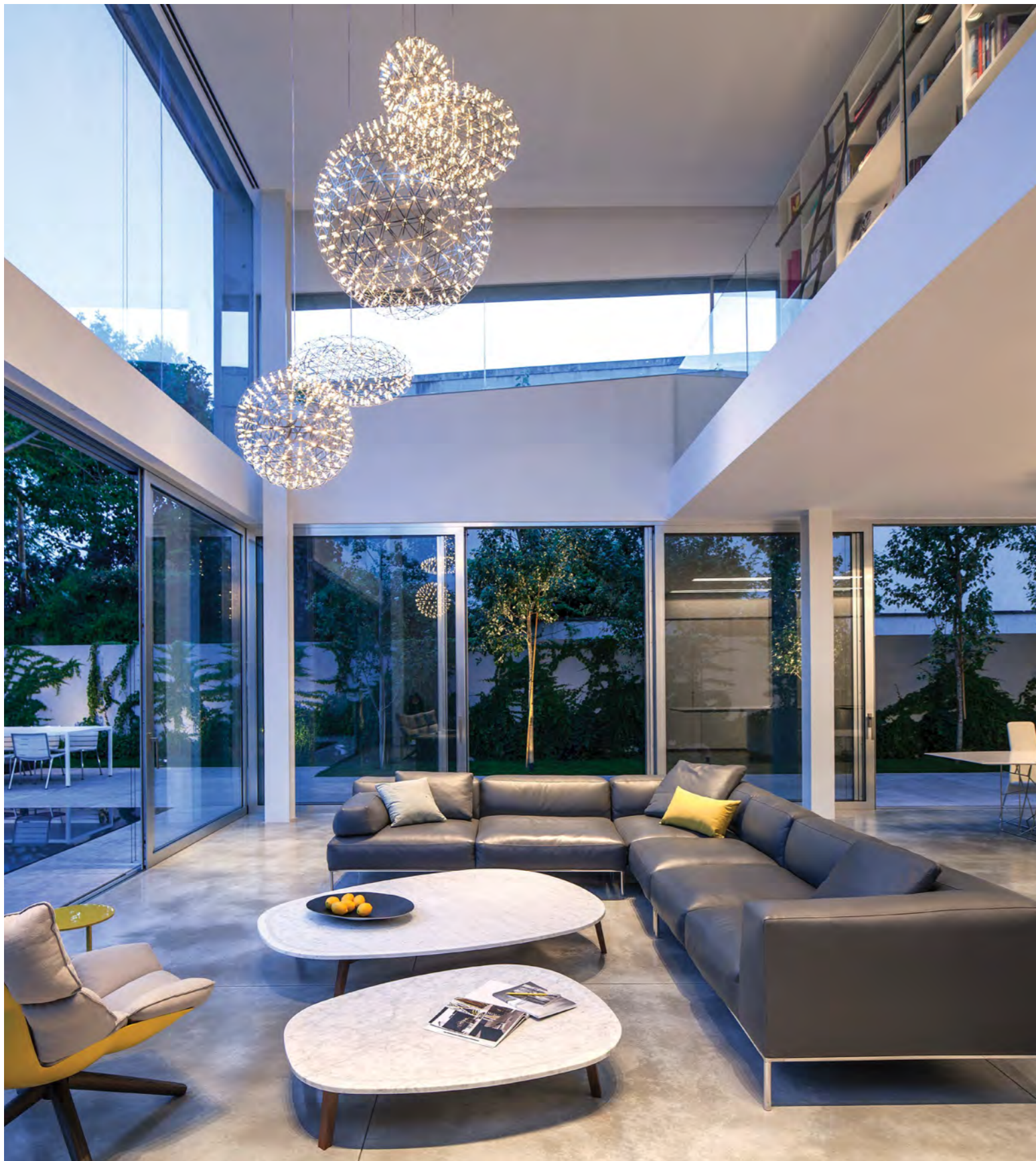
הספרייה שמעל הסלון משקיפה עליו ובכך אחראית על הקשר בין החללים

“בסלון ובפינת האוכל נמשך הקו המהודק והמינימליסטי של האדריכלות, ובתוך הבית נעשה שימוש בבטון גם בקירות וגם ברצפה שיוצרת תחושה שהחומר הזה עוטף מכל כיוון, כשמאחורי הבחירה הזו עומדת התפישה העיצובית של אמונה בשפה אחת ולא בניבוב חומרים.”