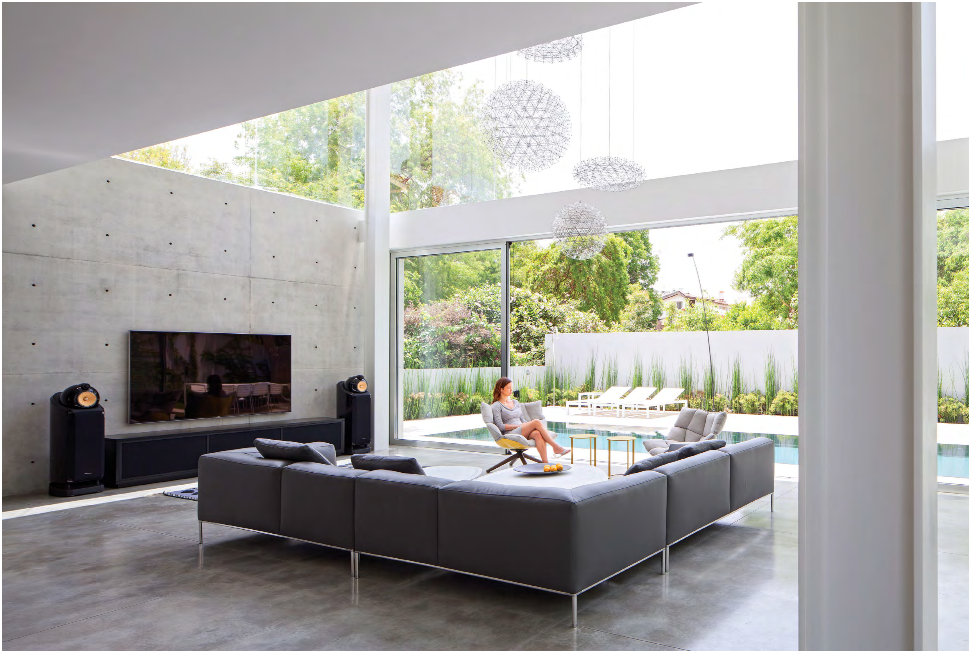
שימוש בחומרים וצבעים- תפישה עיצובית של אמונה בשפה אחת ולא בגיבוב חומרים