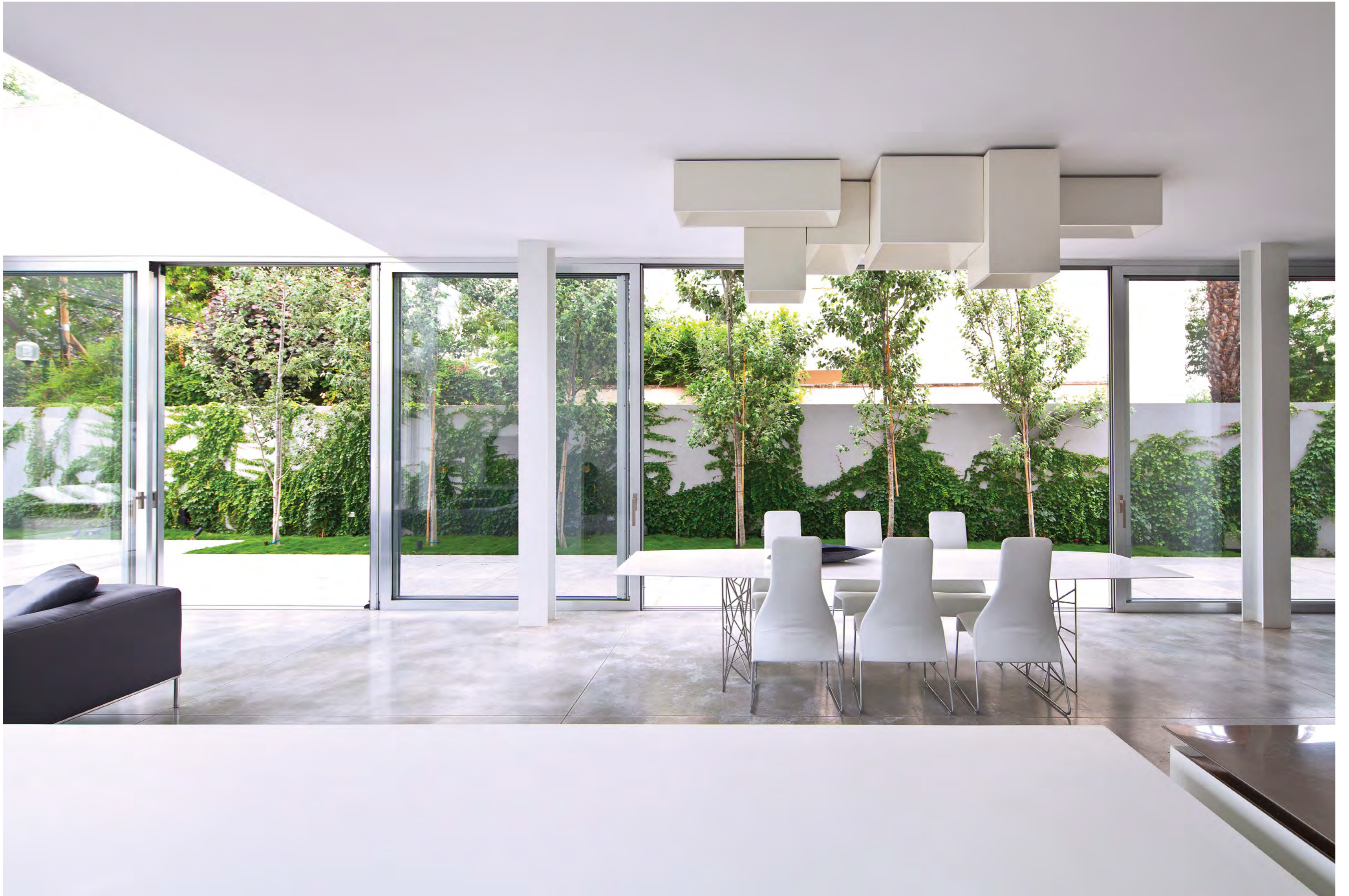
נוף תאורה מעל פינת האוכל מתכתב עם הצבעוניות והצורניות של המטבח שמולו