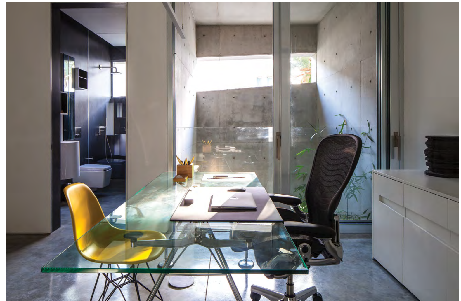
חדר העבודה שמשקיף על הפאטיו עם נגיעה של צהוב

לשני חלקים כבחירה עיצובית כשכל חלק מקבל צבע אחר- צבעוניות, שכמו בשאר הבית, בוחרת בלבן ואפור כגוונים שלה, מתוך ידיעה עתידית שהחיים עצמם יכניסו צבעים נוספים, שעבורם צריך לייצר בסיס מונוכרומאטי וניטרלי. מלבד הקומה הציבורית השיח בין חללים מתרחש בכל הבית, ולא בכדי ייצו מעיד שבתהליך העבודה שלו הוא סתכן בחתך, בניגוד לתכנון בתכנית שמקובל בקרב רוב אנשי המקצוע, שכן הקשר הזה בין החללים אקוטי לדינמיקה של הבית. דוגמא נוספת לכך אפשר למצוא גם במפגש שבין פינת העבודה והפאטיו שצופים זה על זה. לאורך מדרגות הבית מופיעה בזלת בחיתוכים א-סימטריים תלת-מימדיים ומדגישה את הקו האנכי של המדרגות. בקיר הבזלת הזה מושגים גופי תאורה שבליה הפכים לחלק ממנה, ומסמלים